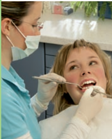
Erhebung des PSI in der Zahnarztpraxis zur Früherkennung von Erkrankungen des Zahnhalteapparates.

Erkrankungen des Zahnhalteapparates sind weit verbreitet und können zum Verlust von Zähnen führen. In Deutschland gibt es immer noch viele unbehandelte Erkrankungen des Zahnhalteapparates. Damit sich das ändert, bezahlen die Krankenkassen seit 2004 eine Vorsorgeuntersuchung zur Früherkennung dieser Erkrankungen. Bei dieser Untersuchung wird der PSI , der Parodontale Screening Index , erhoben. Mit Hilfe des PSI ist es möglich, bereits frühe Formen von Erkrankungen des Zahnhalteapparates zu erkennen. Dies erleichtert die erfolgreiche Behandlung . Alle zwei Jahre können Sie Ihren PSI im Rahmen der ganz normalen zahnärztlichen Kontrolluntersuchungen auf Kosten Ihrer Krankenkasse untersuchen lassen. Fragen Sie Ihren Zahnarzt danach – diese Leistung steht Ihnen zu! Die Deutsche Gesellschaft für Parodontologie setzt sich intensiv dafür ein, dass alle Zahnarztpatientinnen und -patienten diese wichtige Vorsorgeuntersuchung in Anspruch nehmen.